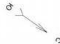
ПЛАН ЭТАЖА 1-й этаж