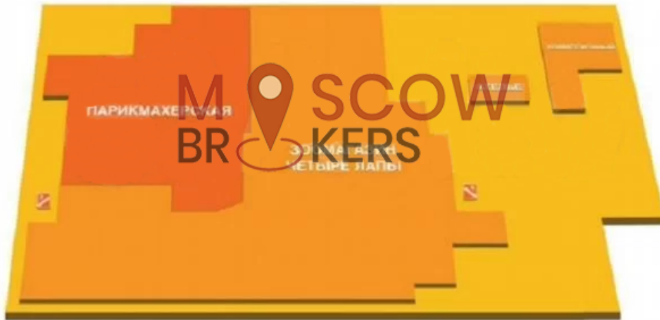
Планировка размещения арендаторов цокольный этаж