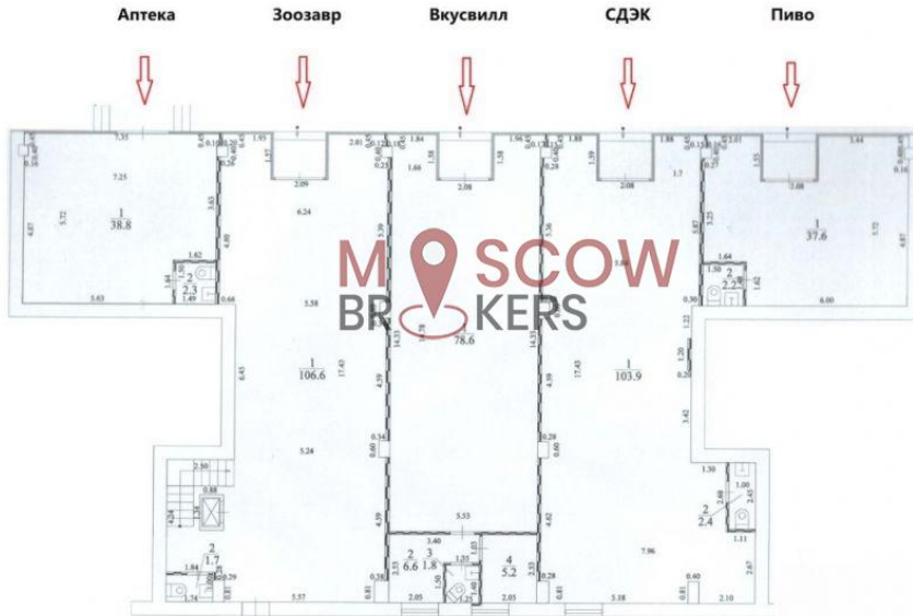
План помещения 569,6 кв.м. с разделением на отдельные помещения с отдельными входами и отдельными кадастровыми номерами