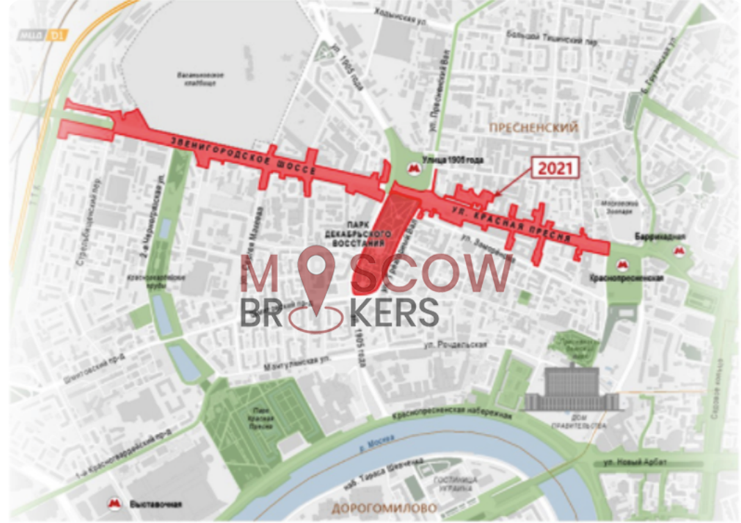
■ Благоустроенные улицы, парки, общественные пространства, видовые зоны в 2011-2020 гг. ■ Объекты, планируемые к благоустройству в 2021 году