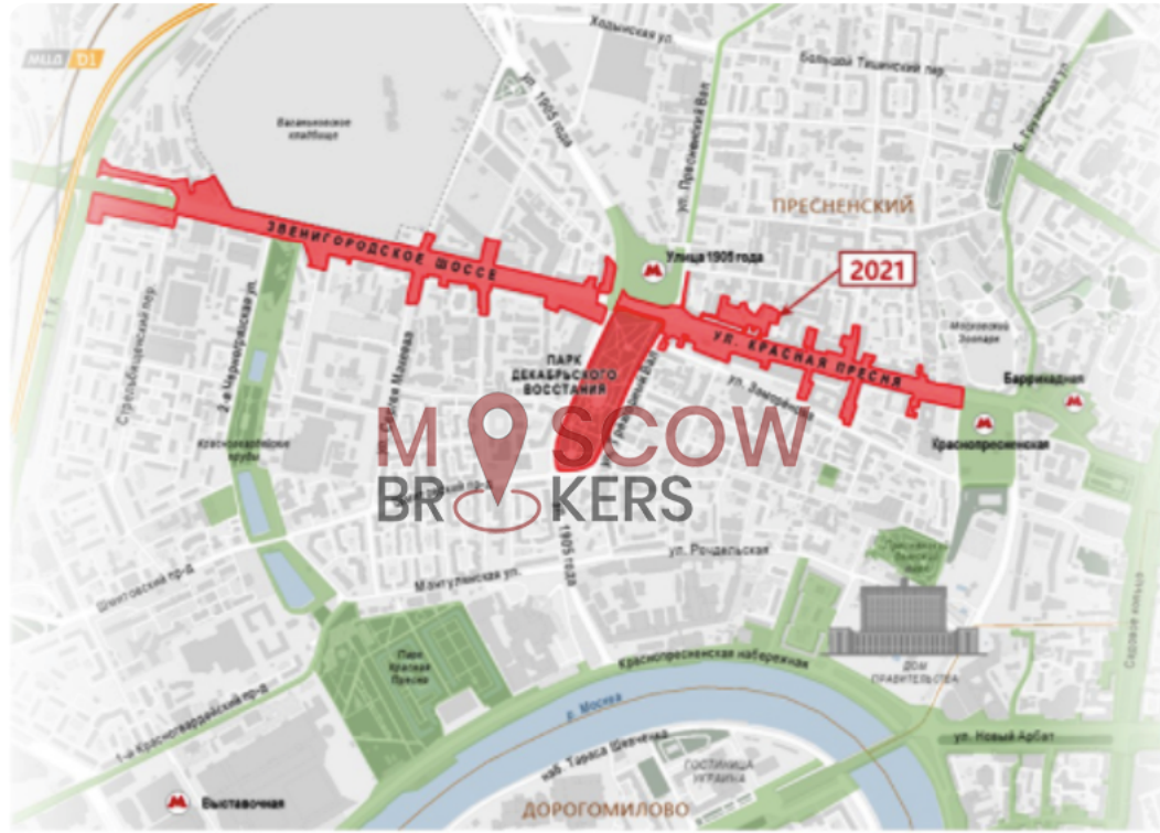
■ Благоустроенные улицы, парки, общественные пространства, видовые зоны в 2011-2020 гг. ■ Объекты, планируемые к благоустройству в 2021 году