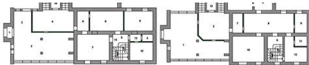
План 3-го этажа