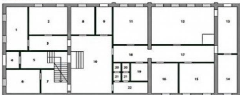
План 1-го этажа