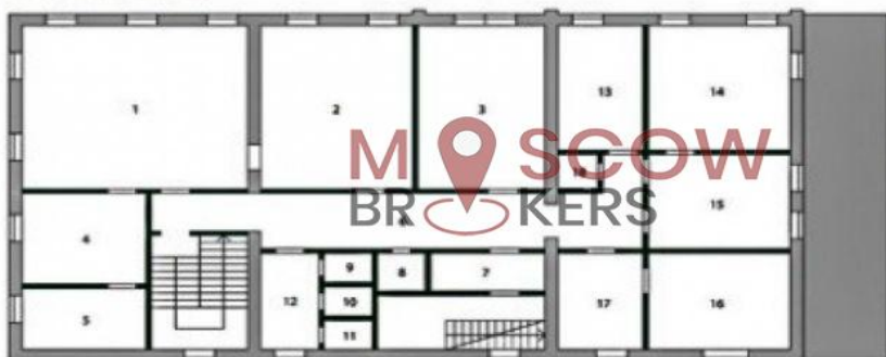
План 2-го этажа