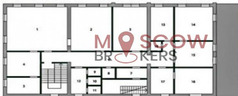
План 2-го этажа